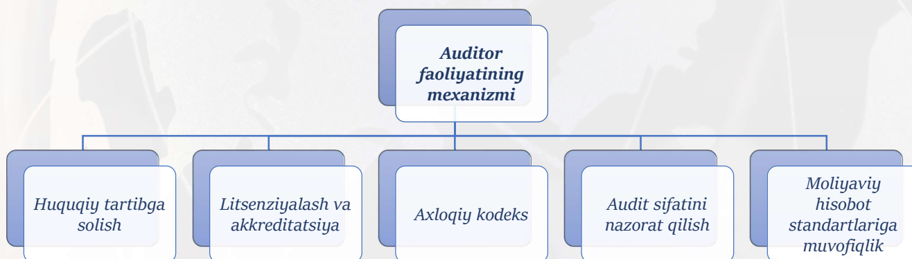
1-rasm. Auditor faoliyatining mexanizmi 1

1. Auditorlik faoliyatini tartibga solish mexanizmlarining tahlili. Auditorlik faoliyatini tartibga solish mexanizmlari huquqiy, tashkiliy, axloqiy va sifat nazorati elementlaridan iborat bo'lib, ular audit jarayonining izchil va samarali amalga oshirilishini ta'minlaydi. Mazkur mexanizmlar auditorlik faoliyatining mustaqilligi, xolisligi va ishonchliligini kafolatlashga xizmat qiladi.