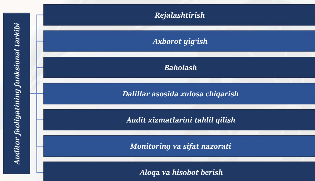
4-rasm Auditorlik faoliyatining funksional tarkiblari 4

dalillar asosida xulosa chiqarish, hisobot berish va sifat nazoratidan iborat funksional tarkiblarga ega.