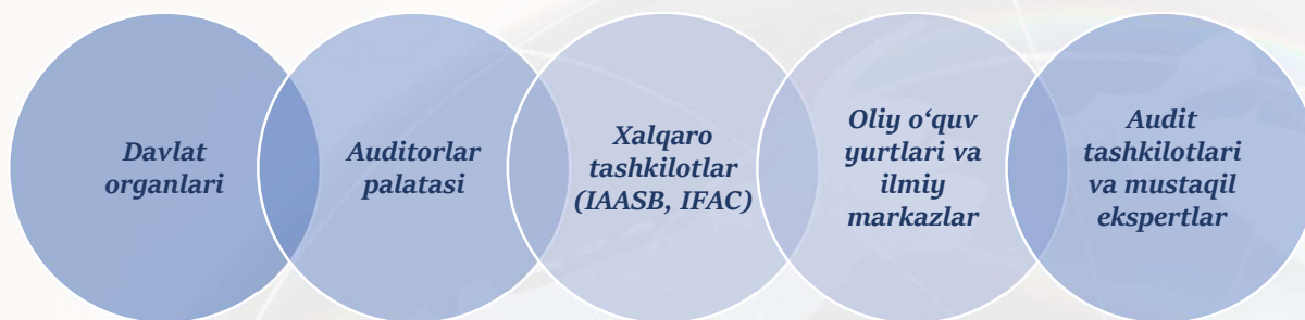
2-rasm. Auditorlik faoliyatining institutsional asoslari 2

Mazkur rasm asosida olib borilgan tahlil shuni ko'rsatadiki, davlat organlari auditorlik faoliyati uchun normativ-huquqiy baza yaratadi va nazorat funksiyasini bajaradi. Auditorlar palatasi va boshqa kasbiy uyushmalar esa auditorlarning manfaatlarini himoya qilish, kasbiy etikani rivojlantirish va malaka oshirishni tashkil etish bilan shug'ullanadi. Xalqaro tashkilotlar tomonidan ishlab chiqilgan standartlar milliy audit tizimini xalqaro talablarga moslashtirishga xizmat qiladi.