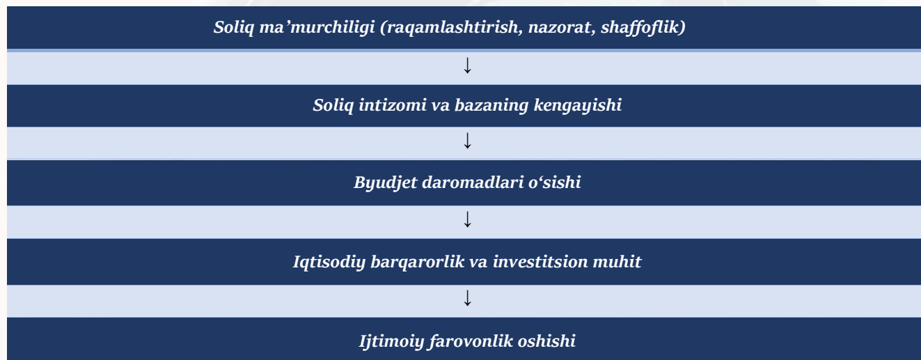
1-rasm. Soliq ma'murchiligi samaradorligining ijtimoiy-iqtisodiy natijalarga ta'sir modeli [5]

ma'murchiligi va uning natijalari o'rtasidagi mantiqiy zanjir grafik ko'rinishda keltirilgan.