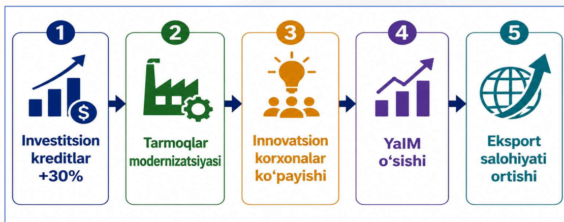
3-rasm. Kreditlar 30 foiz oshirilganda iqtisodiy ta'sir zanjiri 3

Ushbu tadqiqot natijalarida taklif etilayotgan ko'rsatkichning amaliyotga tadbiiq etish natijasida iqtisodiyotning tarkibiiy jihatdan muvozanatli rivojlanishi ta'minlanadi,